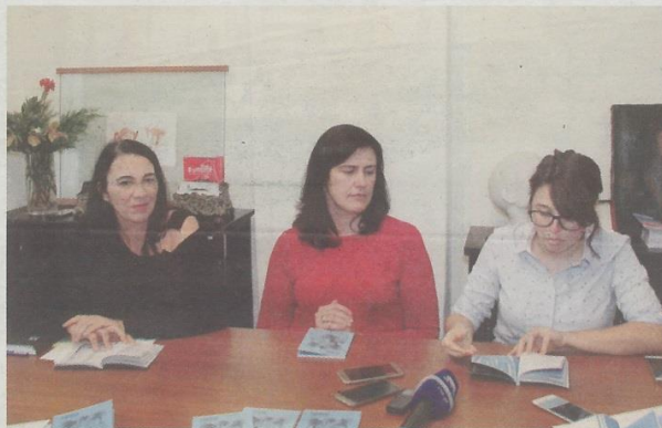
Equipa destacou os principais eventos agendados até ao final de abril.

“Estamos empenhados na criação de públicos e de hábitos culturais (...) O nosso desejo é que cada espetador saia daqui com a sensação de que assistiu a um espetáculo memorável.”